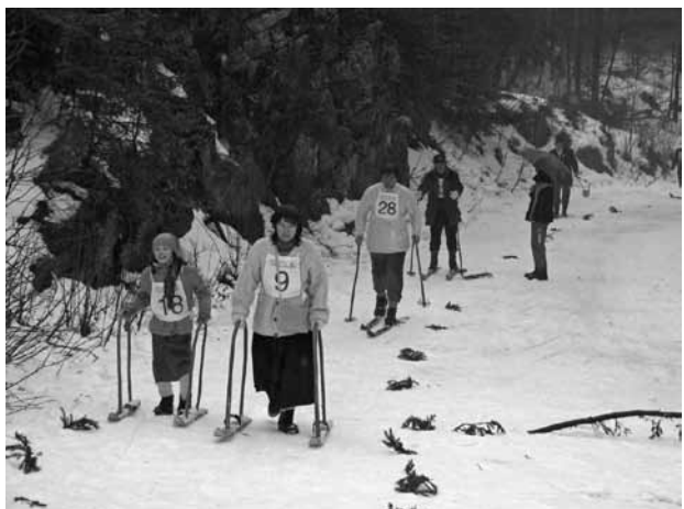
Utrinki z letošnjega Filipovega teka in spusta

Organizacijo 14. Filipovega teka in spusta sem prevzel na pobudo predsednika Društva Gora, Rajka Velikonje. Priprav na prireditve sem se lotil s polno paro in veliko mero optimizma, saj sem dobil podporo vseh, ki sem jih prosil za pomoč. Z delom smo pričeli že skoraj 14 dni pred prireditvijo (zbiranje dobitkov, določanje organov pri organizaciji ...). Kazalo je, da nam bo zima naklonjena z visoko snežno odejo, saj smo imeli dober teden pred prireditvijo skoraj pol metra snega. Nato pa nam je vreme zagodlo, dež in megla sta sneg kar vidno topila. V sredo smo začeli s pripravo