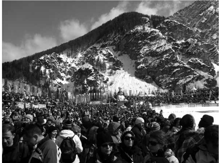
Množica pod Poncami

to hrepenenje po skokih in nenazadnje veselje do Planice ter družinsko tradicijo v dolini pod Poncami. Tudi letos sva se skupaj z Valentino odpravila v Planico in verjamem in upam, da se bova še mnogokrat. Planica ima veliko junakov. Prihajajo z vseh koncev sveta, imajo pa eno skupno točko, uživajo v letenju na smučeh in tekmovanju. Brez Planice si skorajda ni mogoče zamisliti sezone svetovnega pokala v smučarskih skokih-poletih. Dolina pod Poncami je že pravi sinonim za najdaljše polete orlov na smučeh.