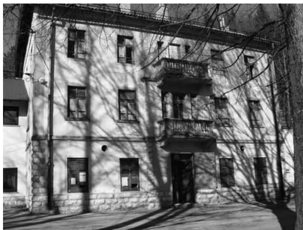
Žalostna podoba Hotela