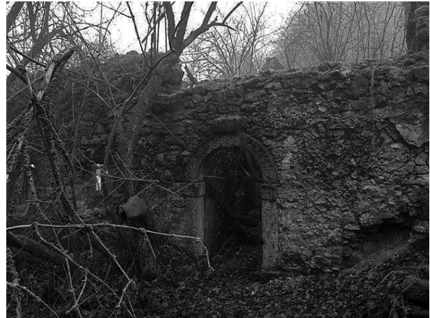
Dober dan, Lipnik ...

Praznični dnevi, božič in novo leto, se bližajo. Končno: po – zdi se mi – neskončnem deževju sončni dnevi. Kam? Lipnik me že dolgo kliče. Graparski mentor mi je nekoč pokazal začetek poti, tam ob Idrijci, na Potoki blizu Stopnika. Kljub močni eroziji v grapi uspem slediti poti, nekdo jo je nekoč celo označil z redkimi knafličevkami. Ledena meglena vlaga, ki se dviga iz Idrijce, bi se mi, če bi ji dovolila, zajedla do kosti, a korak, usmerjen v strmino, me greje. Se pa obeša na vse, kar miruje, priklepa in vklepa jih v led, krasi jih z neštetimi biseri. Serpentina za serpentino, globoko ujedena v rob zaraščajoče se senožeti, me dviguje k svetlobi. Spodaj pa šumi zimska Idrijca, le ona: zvok avtomobilov posrka vase. Kakšno barvo ima! Njene zimske obleke se težko nagledam. Višje slutim steber podirajočega se kozolca. Sonce prodira skozi meglo in že sem ob podirajočih se stenah poslopij. Kot bi isto sliko nekje že videla. Prednja stran – vhod, obrnjen proti soncu; in hiša (kmečka izba). Ste že videli hišo s kmečko pečjo, ki bi gledala kam drugam kot na zahod? Poslopja sedijo, ne, jezdijo na ozkem grebenu, padajočem proti Idrijci. Severno in južno stran pa ji varuje greben, ki pada izpod Leskovega vrha na Šentviški planoti proti Idrijci in se takoj za hišo še zadnjič strmo vzpne v še eno kopico in se prav na mestu, ki so si ga predniki izbrali za svoje domovanje, najbolj zoži. Spet škrbina, le z drugačnim imenom. To je Lipnik, Lipnik pod Šentviško Goro in nad Stopnikom.