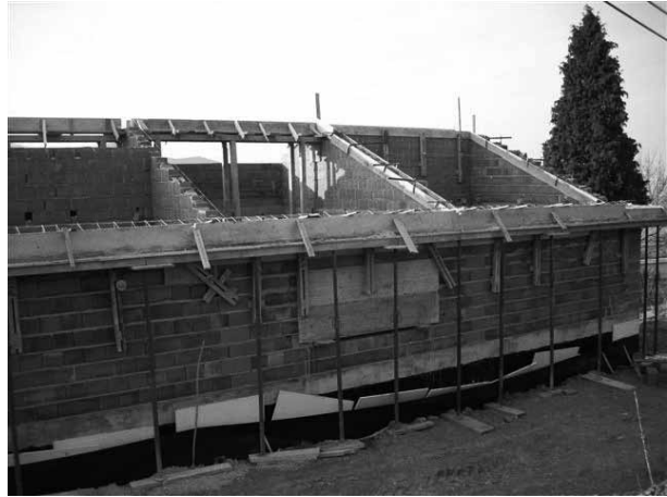
Na colskem pokopališču raste mrliška vežica

Čeprav se je gradnja mrliške vežice pričela že ob koncu leta 2008, nas glavna gradbena dela čakajo predvidoma do junija 2009. Na javnem razpisu izbran izvajalec B CENTER d.o.o., bo gradnjo vežice do četrte gradbene faze po vsej verjetnosti dokončal do predvidenega roka, ki je do konca marca 2009, zato že iščemo izvajalca za dokončanje zunanje ureditve, vključno z razširitvijo pokopališča. Ker stroški omenjene storitve ne presegajo 80.000 evrov, za investicijo ne bo potrebno iskati izvajalca prek javnega razpisa, tako da že dobivamo razne ponudbe. Pričakujemo, da bo do konca marca