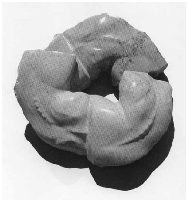
Zmago Posega: Iz cikla 'Krog'