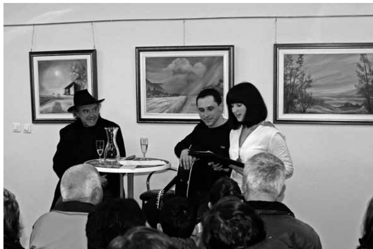
S predstavitve na Cesti

la so razdrobljena, pol izgubljena, včasih najdena; so samo trenutna, ko gredo v eter, in že naslednji dan pozabljena. Ves čas na robu, med svetlobo in senco, med dnevom in nočjo, med pravili in kršenjem pravil, med užitkom in muko, med trajnostjo in hipnostjo. Zanima ga rob in ne uhojena cesta, zanimata ga chiaro – scuro polboemskega življenja, zato je tudi razumljivo, da je na slavistiki napisal diplomsko nalogo o umetniku v Lokarjevih delih in trčil takoj ob Piona, njegovo umetnost in njegovo knjigo Na robu.