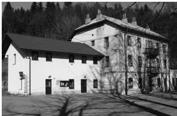
Prenovljena dvorana KS ob starem Hotelu

Samo praznovanje praznika KS pa je spremljalo več vzporednih prireditev, med drugim nastopi