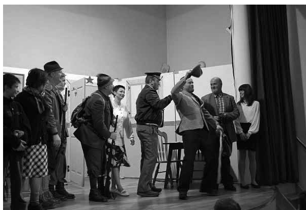
Utrinek s predstave

Zato smo s skupnimi močmi, z Društvom OKNO z Otlice, 26. decembra 2008, na štefanovo, v dvorani na Otlici uprizorili premiero te veseloigre. In z njo doslej gostovali tudi v več drugih krajih.