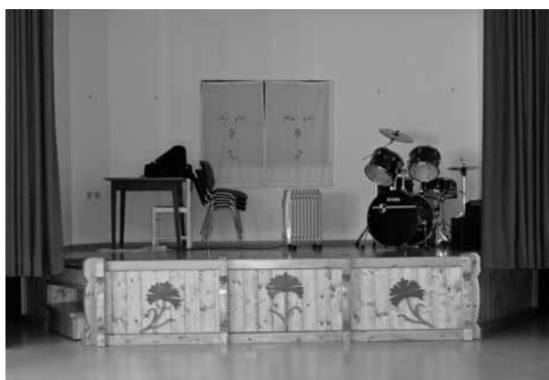
Nova pridobitev v domu krajanov