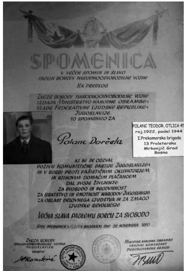
Spomenica, ki nas spominja na Dorčetovo žrtev

13. Proletarska brigada je imela nalogo, da odbije vsak poskus sovražnika, da bi prišel v zaledje Drvarja. 10. maja 1944 se je naša vojska nahajala med Jajcem, Mrkonjič Gradom, zahodno od planine Manjača. Bitka na življenje in smrt je bila strahotna za vse naše borce. Brat Dorče