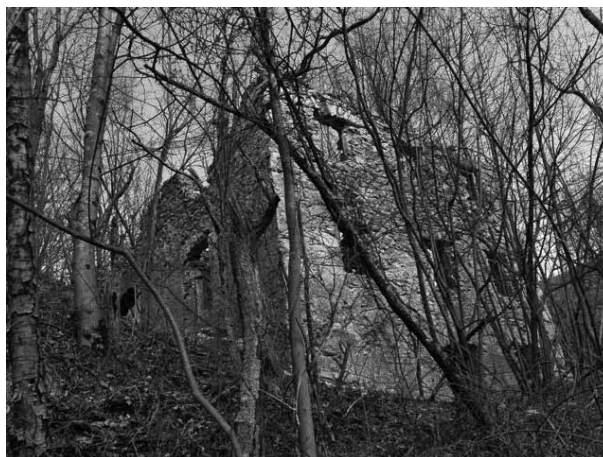
Škrbina, na sedlu, med strmcm in strmcm ...

Tistega dne je bilo vprašanje prava stran, a ker dolinci poti ne moremo začeti na vrhu, se je bilo za njen začetek treba še posebej potruditi na spodnjem koncu. Vedela sem samo to, da poteka po pobočju Kuka, stražarja nad sotočjem Hotenje, Trebušice in Idrijce, Prvejkovega soseda. Senožet pod gozdom ni kazala nobenih znakov poti, v gozdu nobenega odcepa. Nič, potrebno jo bo poiskati. Pričnem kar naravnost po neizraziti grapi, dvigovala se bom toliko časa, da jo prečim. In res, prav kmalu sem na njej. Od tu naprej je vse enostavno. Lahko se