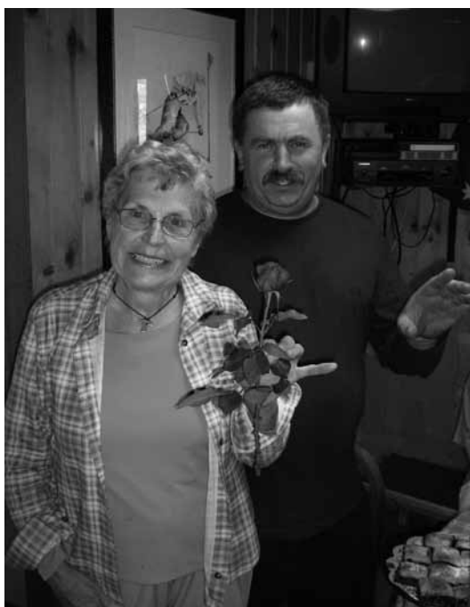
Nekaj utrinkov s srečanja