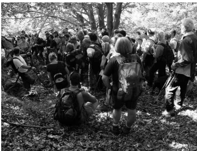
Pri studenčku pod Lisnikom v Stumbružu