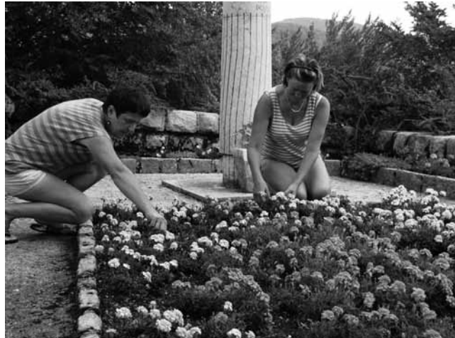
Pridne roke skrbijo za gredice

Vsako pomlad, kmalu ko izgine zadnji sneg, se lotijo temeljitega čiščenja in prekopavanja. Po 1. maju ponavadi mine nevarnost pozebe in slane na Gori, takrat nabavijo sadike cvetja in jih posadijo na pripravljene gredice. Takrat je potrebno še posebej paziti na mlade rastlinice in jih skrbno negovati. Grobnica leži na sončni legi, v Bregu, kjer je tudi plast zemlje tanka in sušna, zato je poleti obilno, pogosto zalivanje nujno. Vsa prejšnja leta so morali vodo voziti od doma (tudi po 200 litrov naenkrat) in jo nositi do Grobnice. Zdaj, pravijo, so zelo zadovoljni, ker jim je lastnik tovarne na Predmeji prijazno omogočil priklop na njegovo vodno omrežje (stroške porabe krije sam), lastniki zemljišč pa so dovolili napeljati vodovod čez svoja zemljišča. Preko celega leta imajo vseeno obilo dela z vzdrževanjem, vse do komemoracije 31. oktobra, ko tam priredimo krajšo slovesnost, v počastitev padlih žrtev ob dnevu mrtvih. Po prvi slani pa se cvetlice posloviijo in očiščene gredice so pripravljene na zimski počitek, ljudje pa tudi.