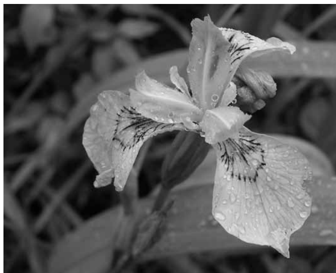
Perunikin cvet, simbol popolnosti, svobode, življenja

pa so več kot meter. Vodne perunike imajo v zemlji močno koreniko, iz katere izraščajo dolgi, črtalasti listi. Zgornji listi pa so krajši in objemajo steblo in cvet.