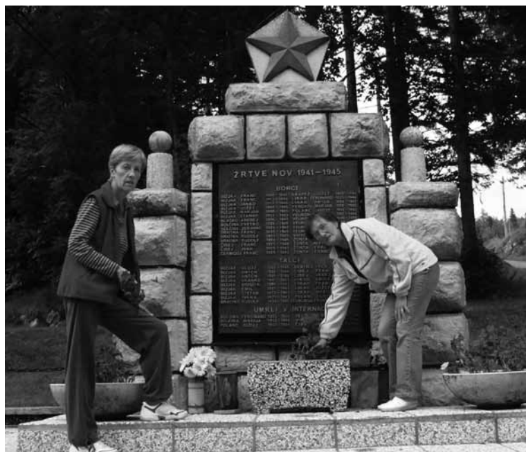
Tudi Spominski park je lepo vzdrževan