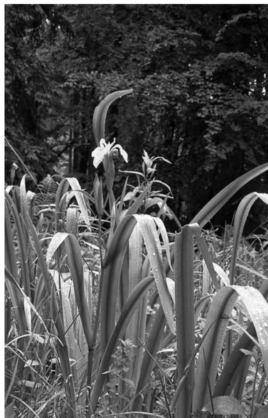
Vodne perunike v Trnovskem gozdu

pa so več kot meter. Vodne perunike imajo v zemlji močno koreniko, iz katere izraščajo dolgi, črtalasti listi. Zgornji listi pa so krajši in objemajo steblo in cvet.