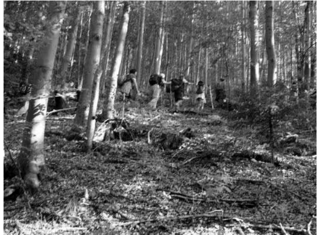
Proti prvemu studenčku v Kaplcah