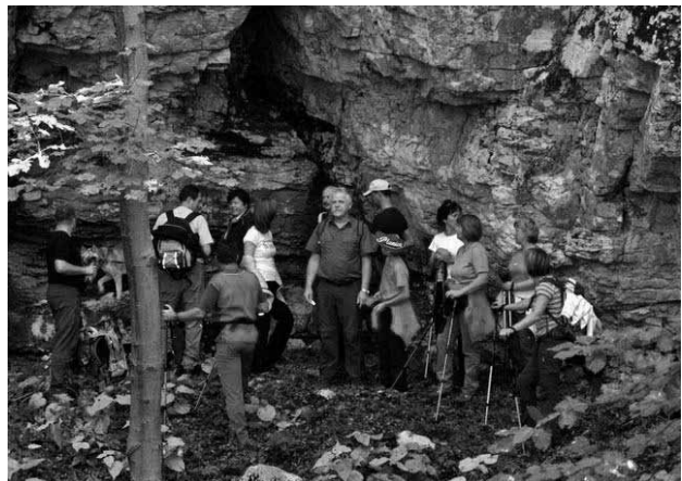
Kraška jama v Zavelbu skriva drugi studenček