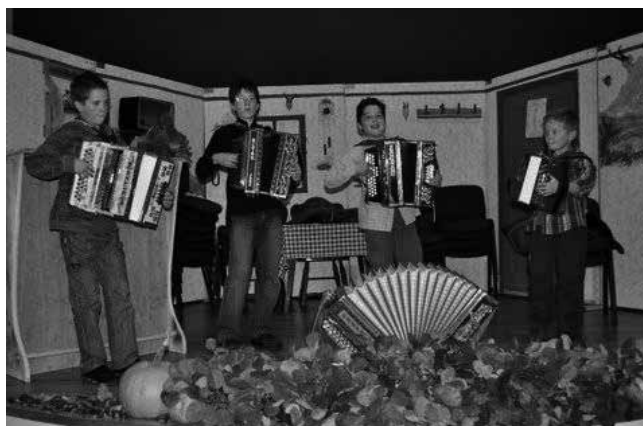
Mladi harmonikarji so navdušili

Letos smo člani društva pripravili potek srečanja na malo drugačen način, saj smo za rdečo nit prireditve izbrali vložke iz naše domače igre Medved izza Medvedjega vrha, in moram reči, da nam je to, po odzivu občinstva in tudi samih nastopajočih, popolnoma uspelo. Na odru se je zvrstilo 14 fantov in deklet, ki jih je kelnarca Sabina predstavila občinstvu in hkrati izbirala muzikanta za igranje na njeni ohceti, ki jo je obljubljala že v sami igri. Sabina se na koncu ni mogla odločiti za najboljšega, zato je na ohcet kot muzikante povabila vse, in to