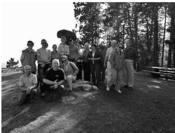
Letošnja generacija varuhov gorske narave pri spomeniku Gorjanki