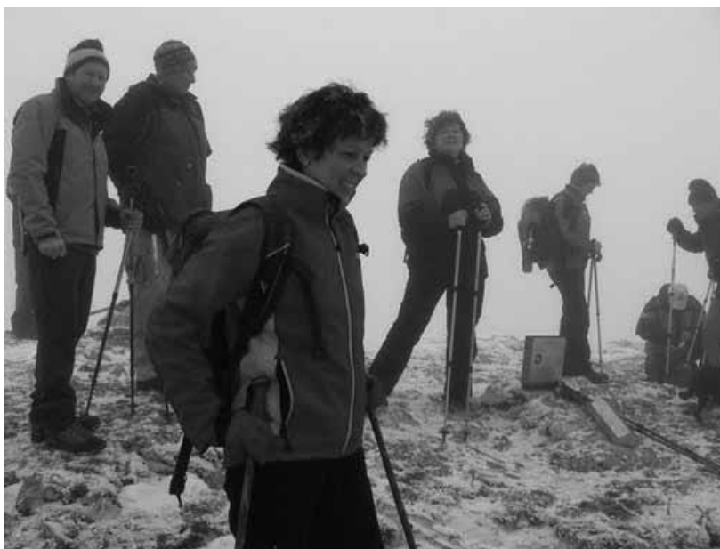
Zima na Velikem vrhu

Kapelica je bila zgrajena 24. junija 1928. Do leta 1941 so bile v njej redne nedeljske maše, včasih pa so si tudi duhovniki