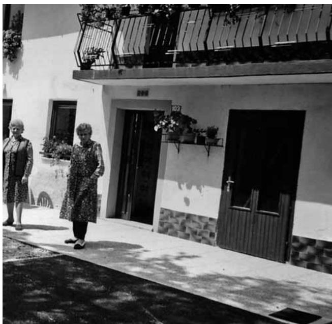
Pred domačo hišo

Tako Italijani kot Nemci so bili do nas okrutni. Ustrahovali so nas eni in drugi. Nemci so požigali naše domove, tako na Predmeji kot tudi na Otlici. Naša hiša je k sreči ostala. Nemški vojaki so kradli in ropali. Nič, kar je bilo našega, jim ni bilo sveto. Okradli so nas, da smo bili ob vse. V maju 1945 so se Nemci pričeli umikati. Med umikajočimi Nemci so bili tudi kozaki, četniki, ustaši, Rusi in domobranci. Po vojni smo bili brez vsega. Okupa-