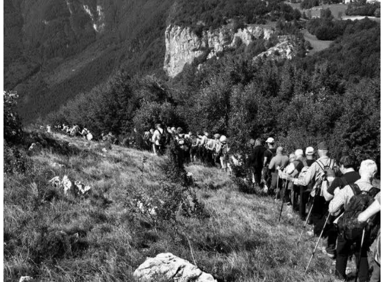
Z Dolskega Maja pa naprej