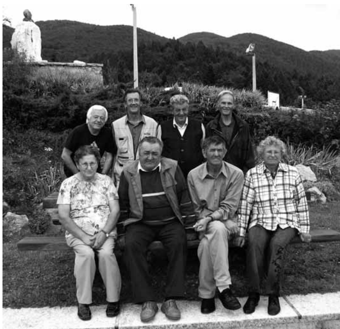
Zbrana družčina letnika 1939

Sivi Čaven! Ne, le mi smo nekoliko bolj sivi. Čaven je za nas nekaj posebno lepega in svetlega: za tiste, ki živijo na Gori, kot za tiste, ki prihajajo iz drugih krajev v rojstno vas. Ko zagledaš Čaven, je pod njim Gora. Naša Gora! Gora! Kolikokrat je bila izrečena ta čarobna beseda, javno in v naših srcih! Kolikokrat? Odgovora ni, saj se ne da prešteti veličine ljubezni, ki jo gojimo do našega rojstnega kraja.