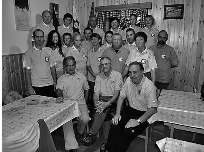
V koči na Javorniku