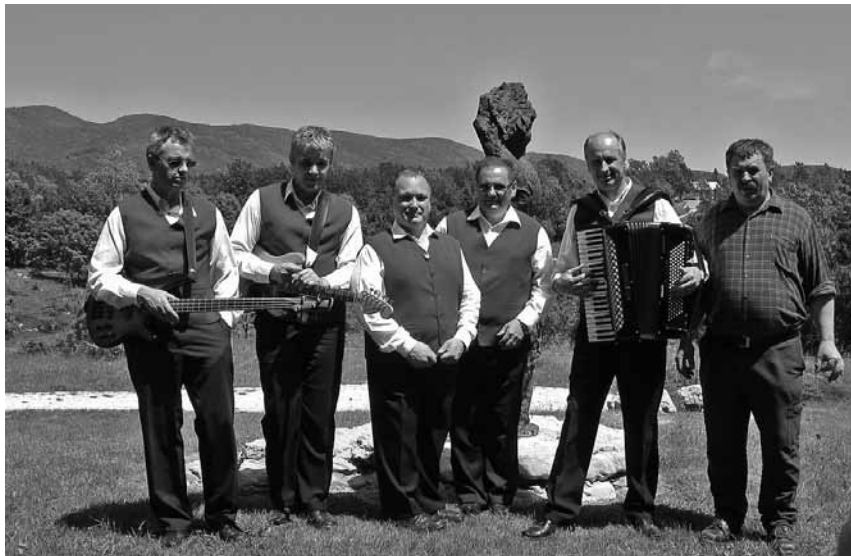
Beneški fantje na Predmeji

Gorska tiha noč se poslavlja. Poraja se prvi svit in raste v sončno jutro. Čaven že obsijejo prvi žarki: z Ivotom Saksido s TV Vitel sva že na Bevrci. Ivo v kamero lovi gorske rože, Goro pod nama, gore nad njo ... Potlej se odpeljeva v Smrečje. Trave pijejo bogato jutranjo roso, da bodo laže preživele vroč dan; pajek v grmu je kot z biseri obdan, ko se sonce ujame v roso na njegovi mreži.