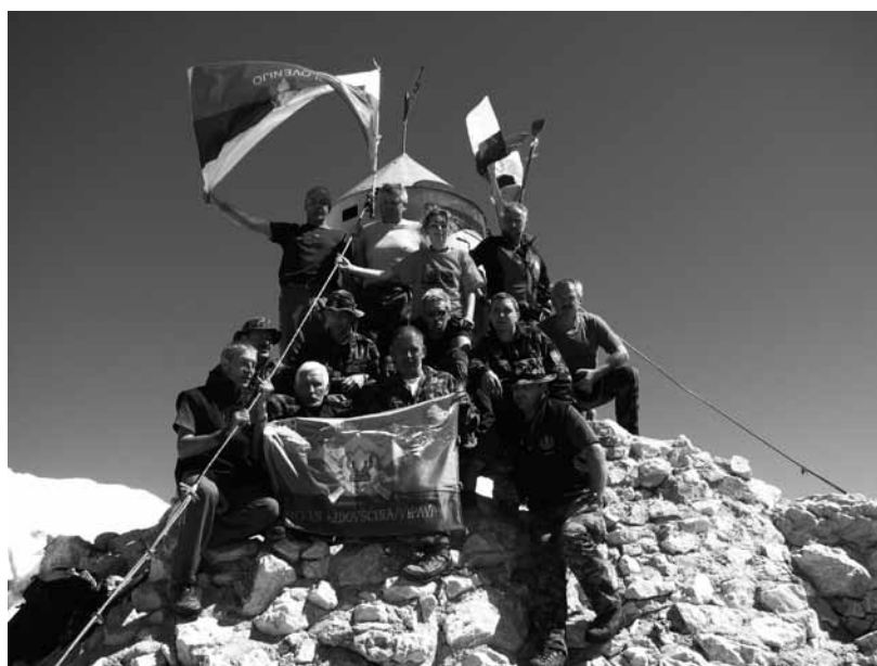
Na vrhu Triglava

Prelepo sončno jutro, ko po obilnem zajtrku okrog 8. ure krenemo na Triglavske pode, na melišče pod vršno piramido Triglava. Na osojni strani mrzlo in močno piha, tu se oblečemo, nadenemo si alpinistične čelade, navežemo z varnostnimi vponkami. Sledijo še varnostni napotki vodje po-