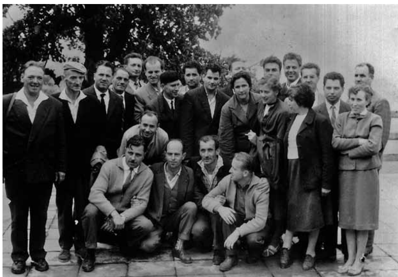
Okrevanci in osebje bolnice Pavla na srečanju leta 1960