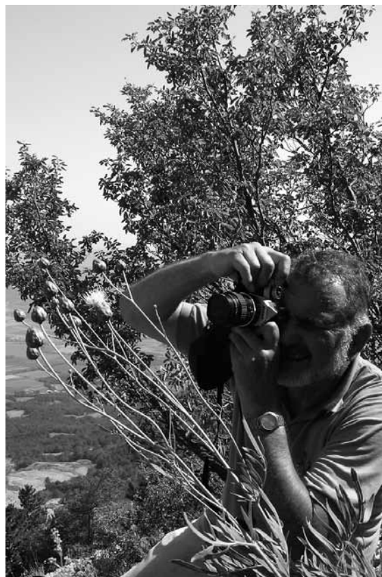
8. julij 2004, pri alpskem glavincu na pobočju Čavna