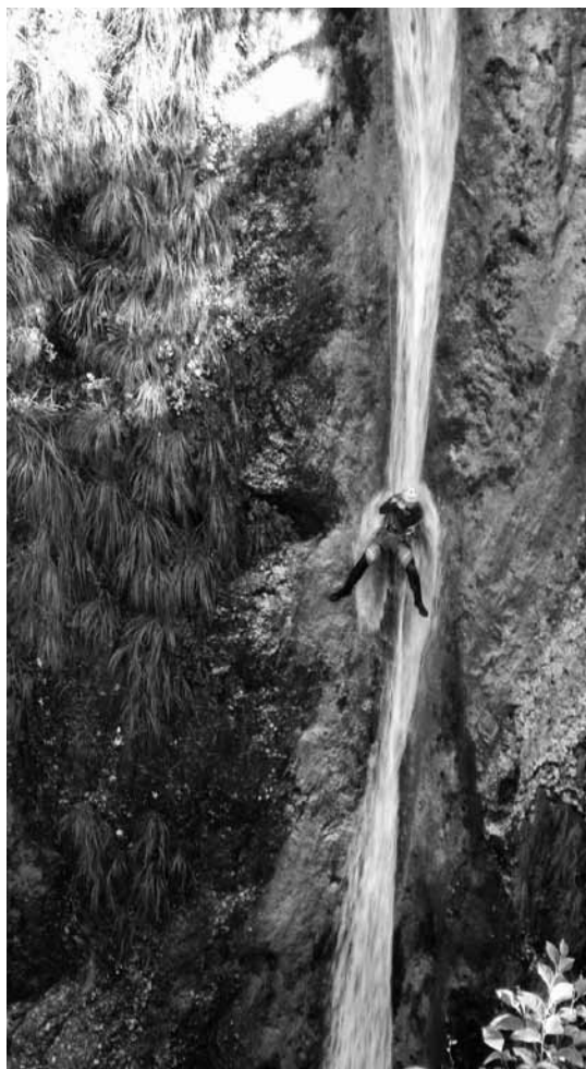
Španski kaskader na Gačnikovem slapu ...