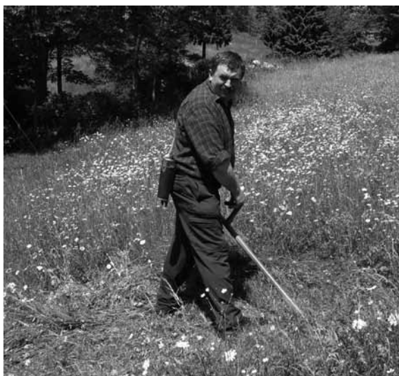
Kosa v mojih rokah