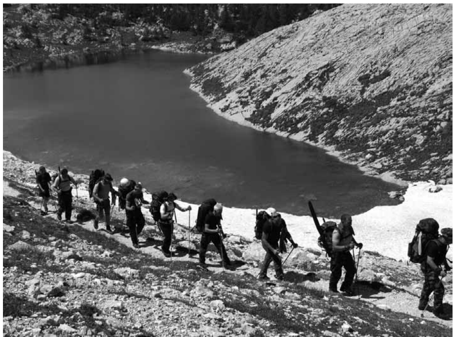
V našem visokogorju

Nadaljujemo po dolini Triglavskih Sedmerih jezer, kjer nas preko Hribaric čaka izjemno strm vzpon na pode pod Kanjavcem. Tu je svet položnejši, vendar s še kar nekaj debelo odejo snega. Z grenkim priokusom smo še lani strmeli v ruševine planinske kočice na Doliču, a ko v popoldanskih urah prisopihamo do Doliča, nas planinska kočica pričaka v novi – obnovljeni in nedokončani podobi.