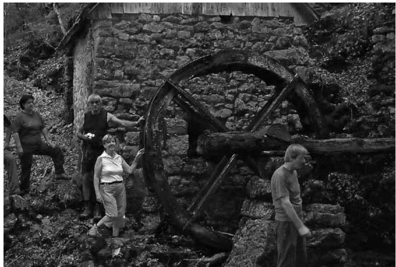
Ob mlinu ...

Zelo malo Gorjanov, in celo Trebušanov samih, pa pozna vse naravne lepote Trebuše, njene vode, slapove, tolmane, brzice, soteske in kotlice, ki so, po prepričanju marsikaterega obiskovalca, v samem vrhu svetovnih lepot; in kar je danes zelo pomembno, tudi voda je čista in celo zdravilna. Potok Trebušca, ki izvira nekje pod Hudim poljem, ima, preden se izlije v Idrijco, več kot petnajst pritokov, od teh pet večjih, vsi pa so res lepi. Prvi in najdaljši je potok Gačnik, ki ima deset večjih in okrog trideset manjših slapov; drugi je potok Pršjak, poznan po svojem najvitkejšem, sedemindvajset metrov visokem slapu; več je še manjših, ki so laže dostopni. Večina slapov na teh dveh