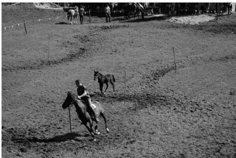
Konjeniki so prikazali veliko spretnosti