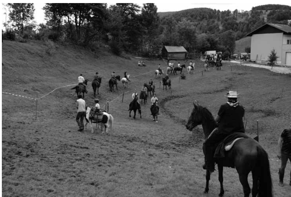
Zadnje priprave pred tekmo

za razvoj, saj smo tako-rekoč sredi Slovenije – torej prav vsem dovolj blizu, imamo zanimive zgodbe in še zanimivejše ljudi, primerne prostore, zgodnjo pomlad in pozno poletje, ... Je pa dejstvo, da se je potrebno za dobro zabavo tudi močno potruditi. Zgolj »zvezdniško ime« na plakatu že dolgo ni več dovolj za vedno bolj zahtevnega potrošnika, ki si želi predvsem pristnih in atraktivnih doživetij. In doživetja na Konjskih dirkah v Gozdu so zanesljivo »primer dobre prakse«.