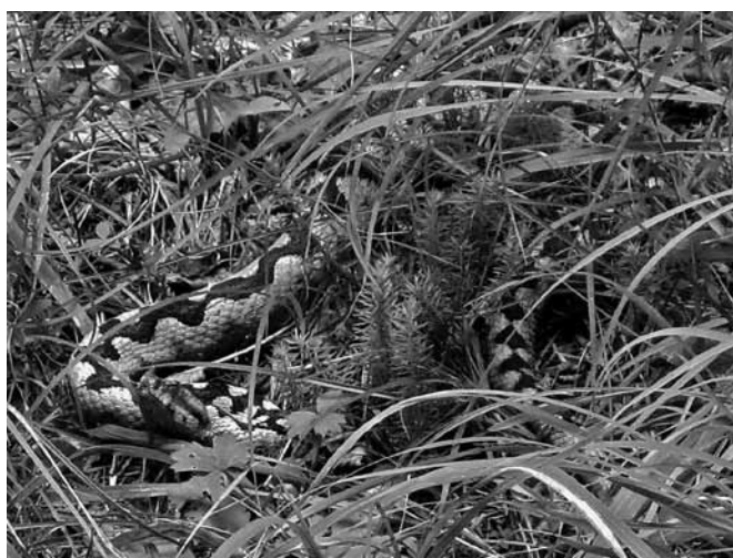
Trebuški modras ...