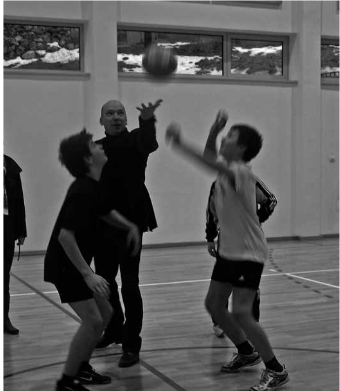
Tako se je začela prva tekma v naši novi telovadnici